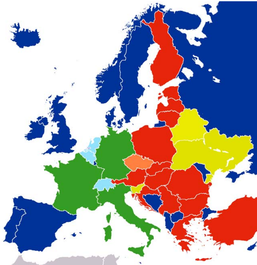
Gasimporte aus Russland